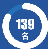
“英才兴蒙”工程 人才类别认定