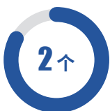
国家级科普教育 基地