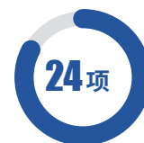
省级以上科研成果奖