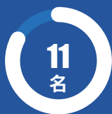
自治区高等学校青 年英才支持计划